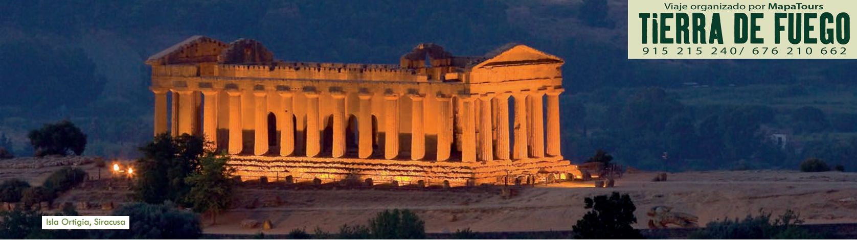
Isla Ortigia, Siracusa