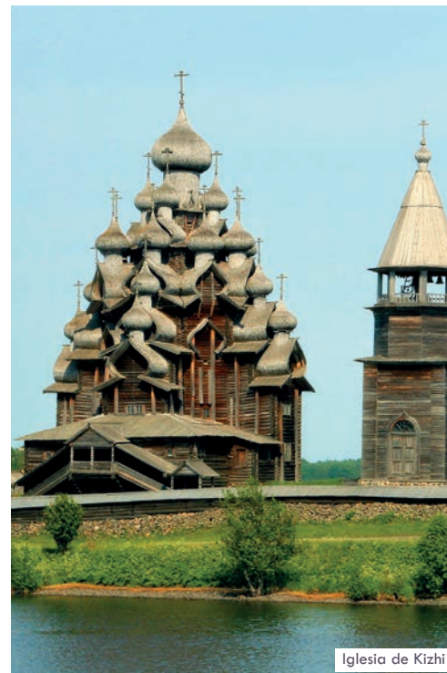
Iglesia de Kizhi

Desayuno a bordo. Navegación por el lago Onega, segundo por su tamaño en Europa. Llegada a la pequeña isla de