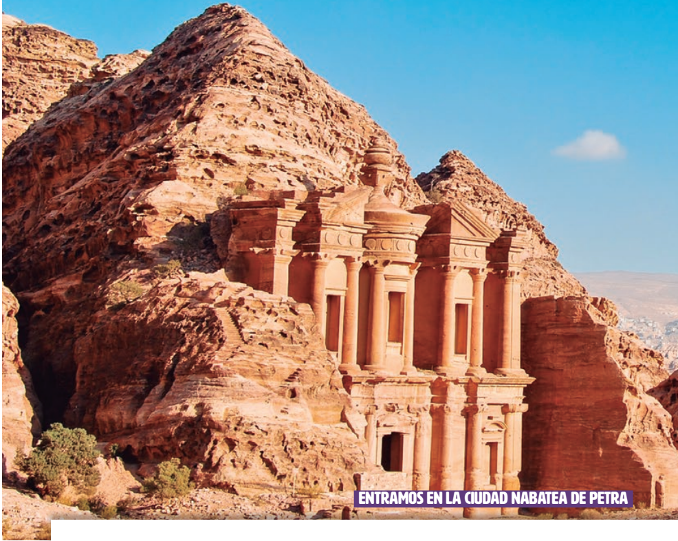
ENTRAMOS EN LA CIUDAD NABATEA DE PETRA