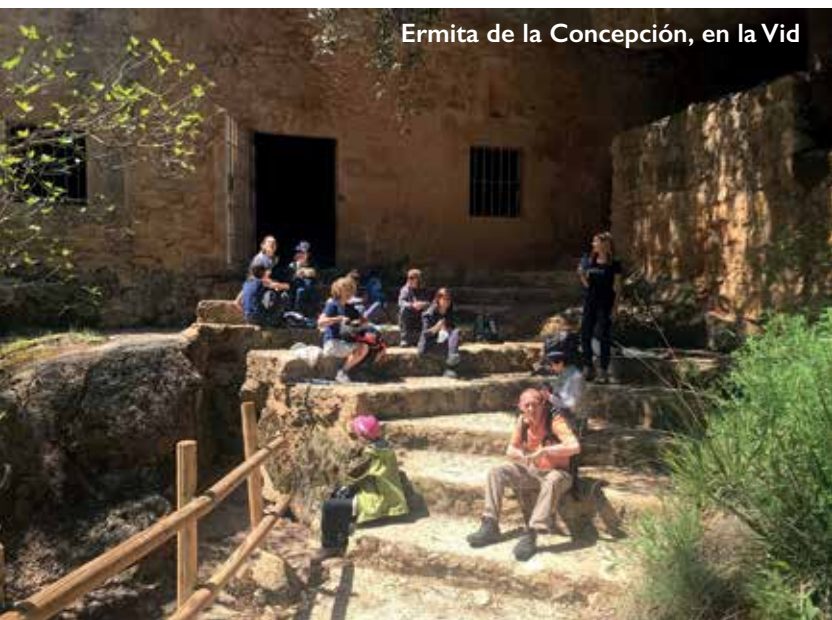
Ermita de la Concepción, en la Vid

Desde el pto de Navacerrada bajaremos al parking de la Barranca, 9h/19€/9 km/↗100(140)m/↘530(570)m/Pza Castilla/Sin desayuno